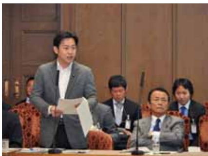
委員会では分担して答弁に立ちます