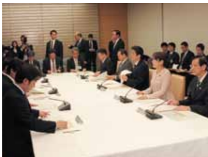
首相官邸での会議