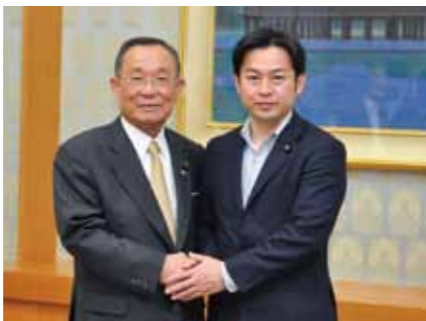
山崎参議院議長と