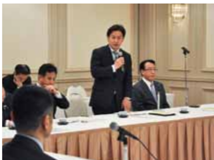
各種議連の役員も努めています