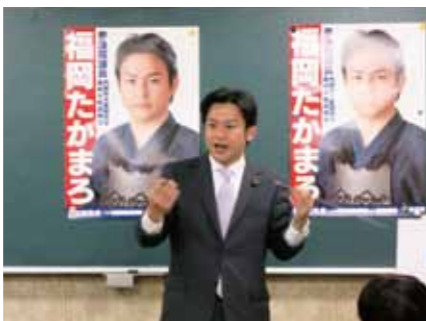
県内各地で国政報告をさせて頂いています