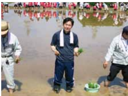
献穀田での田植えに参加