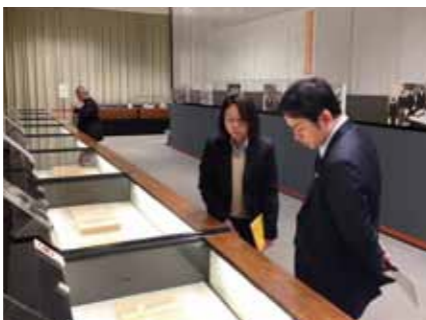
国の記録を後世に残す公文書管理も担当です