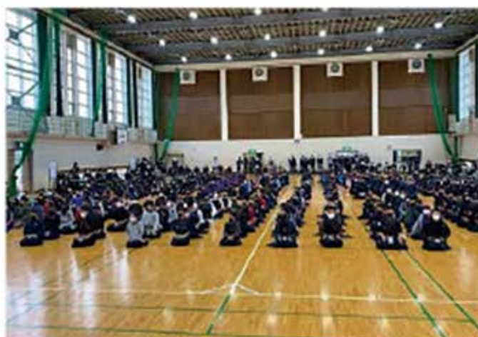
第45回佐賀県道場少年剣道学年別個人選手権大会