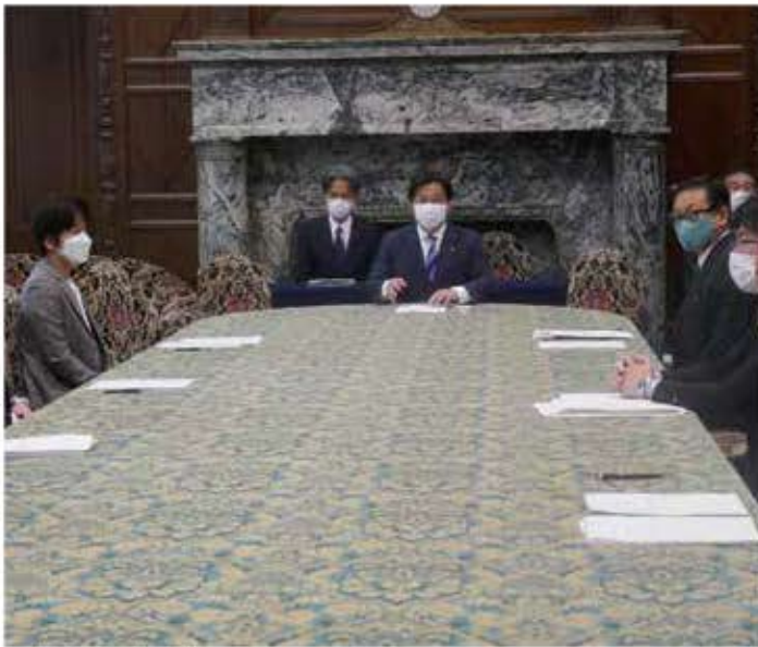
議院運営委員会理事会

場合であっても、最後まで各会派間の窓口となつて理事会協議を重ね、事態を打開、收拾するための糸口を探るのが役割です。このことから、議院運営委員会は国会の赤十字的な性格を有しているとも言われています。与野党で対立している法律案に関して本会議の日程を協議する際には、与野党で合意が得られず、委員会で採決をもって可否が決定されることはありますが、理事会で各会派の意見や主張を丁寧に聴き、可能な限り合意の上で各案件を協議決定することを目指していくことが委員長としての重要な役割であると考えています。