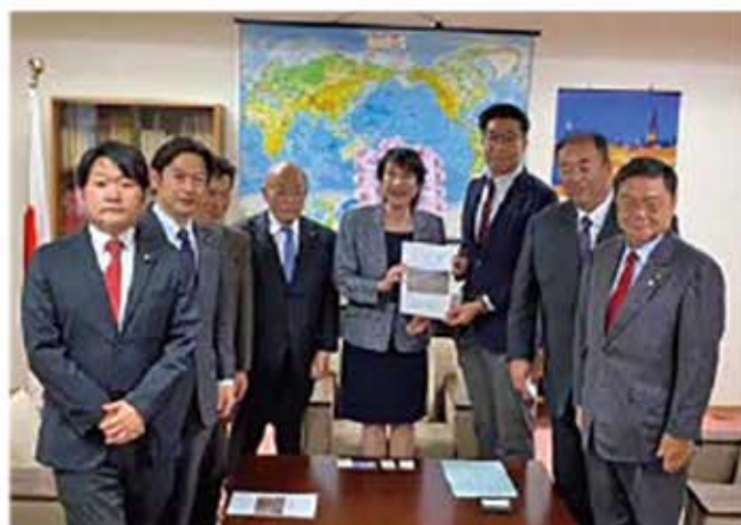
六角川の河川整備促進の要望活動