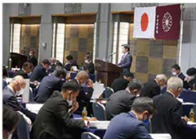
自民党佐賀県参議院第一支部総会