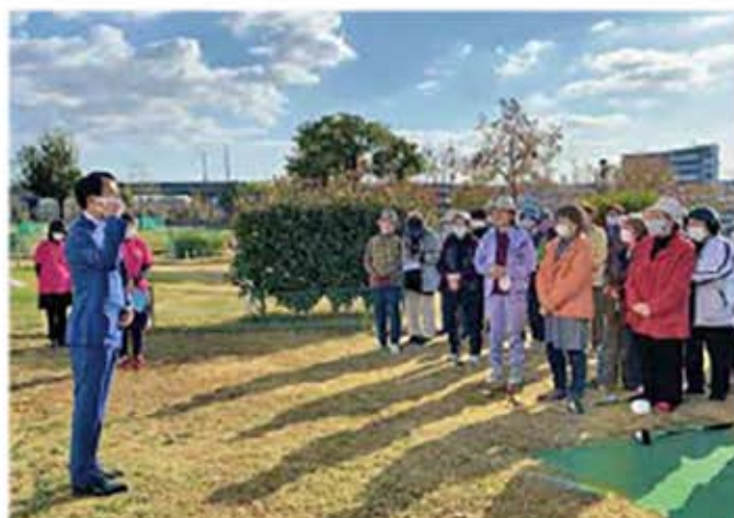
自民党佐賀市支部女性局主催第7回パークゴルフ交流会