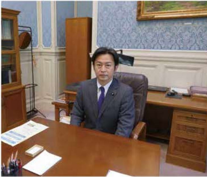
議院運営委員長室にて

議院運営委員会は、国会審議をめぐって与野党が対立して国会が空転または紛糾している