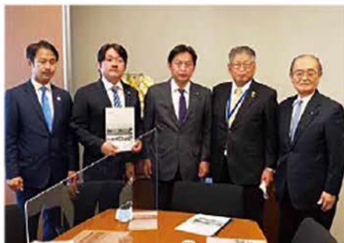
城原川ダム建設および河川改修促進に関する要望