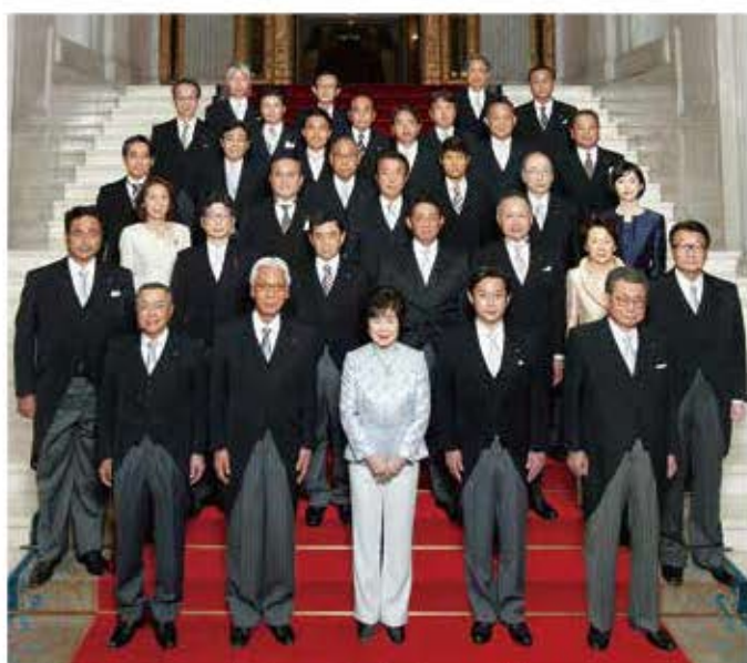
参議院議長、副議長と各種委員長(最前列右から2番目が本人)

協議される内容を具体的に挙げていくと、本会議の日程を始め、各委員会の構成、特別委員会の設置、会期および会期延長、本会議における議案の趣旨説明、国会同意人事、閣僚の海外出張、委員派遣、公聴会開会等の承認、その他議院の庶務的事項など、非常に広範囲にわたります。常任委員会のひとつではありませんが、所管省庁に関する法案等を審議する他の委員会とは異なった性格を持っており、他にも、委員会に議長、副議長が必ず出席すること、常任委員