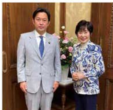
山東前参議院議長と